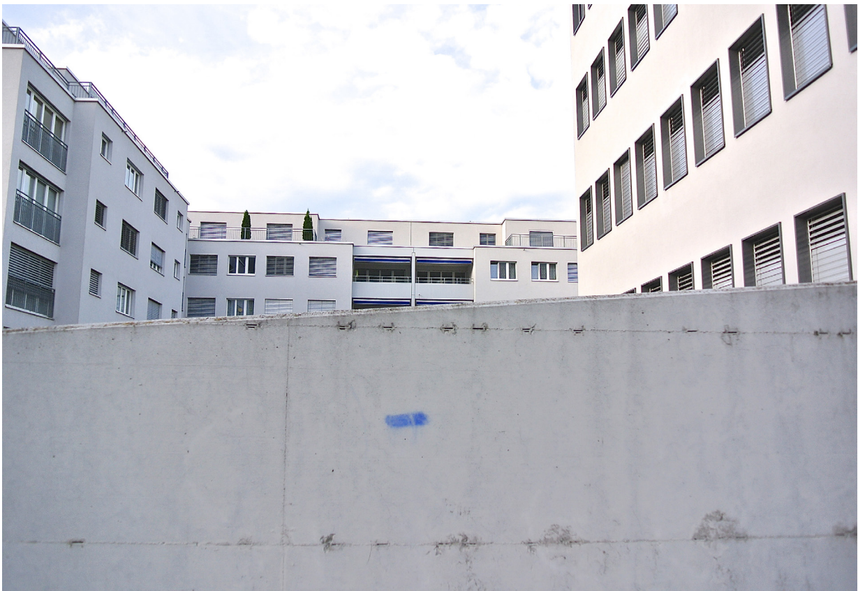
Region Pfäffikon SZ, Prospekt 13